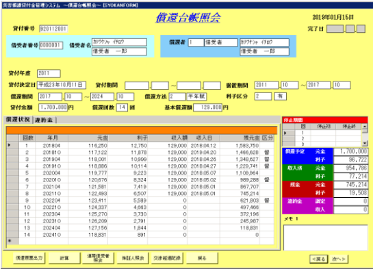
償還台帳照会画面

償還台帳照会画面では借受者情報や貸付情報、償還状況が一つの画面で確認することが可能です。