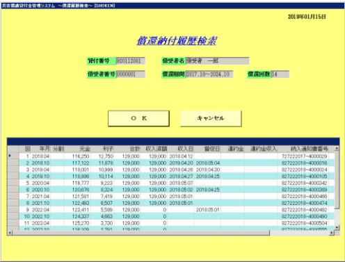
償還納付履歴画面

災害援護貸付金の償還事務は納付状況の確認や督促管理、違約金計算等、様々な管理作業が発生します。本システムは住民記録情報や償還情報との連携を行っていますので、効率的な事務作業が可能となります。