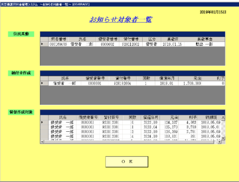
お知らせ対象者画面 (アラート機能)